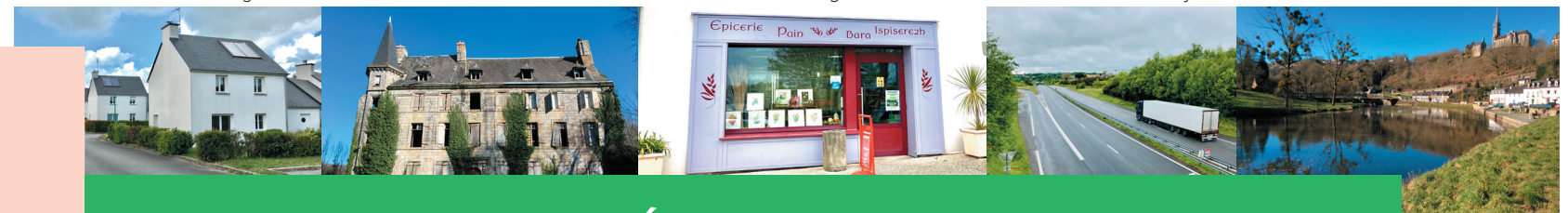
Route Nationale 164 à Pleyben Canal de Nantes à Brest

COLLECTIVITÉ DE L'AVENIR, POUR DES ENTREPRISES DYNAMIQUES, DES INFRASTRUCTURES MODERNES, UNE AGRICULTURE RÉMUNÉRATRICE ET UNE NATURE PRÉSERVÉE.